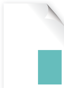
1/4 Pág. Horizontal